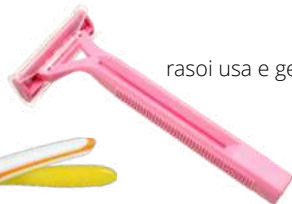
rasoi usa e getta