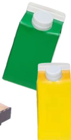
Tetra pak (raccolta carta e cartone)