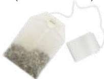
Bustina the (raccolta umido)