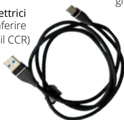
Cavi elettrici (da conferire presso il CCR)