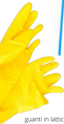
guanti in lattice