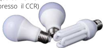
Lampadine (da conferire presso il CCR)