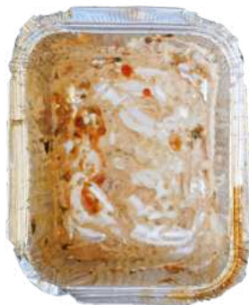
Vaschetta alluminio (raccolta plastica e metalli)